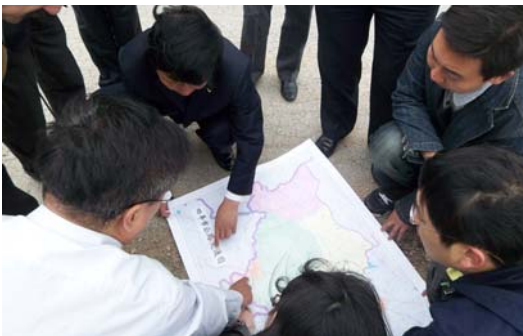
Localización de Ubicaciones para Parques Eólicos en las inmediaciones de Siping, China.

La delegación de AFIC firmó un principio de acuerdo para construir un parque eólico de 60 MW en las inmediaciones de la ciudad de Siping que se estima tendrá unos 30 molinos de viento.