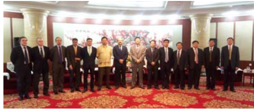
La delegación de AFIC recibida por el Alcalde de Siping el Excmo. Sr. Liu Xihan

en proyectos hospitalarios, tratamiento de aguas, parque eólico, hotelero, bodeguero y de construcción de carreteras y autopistas.