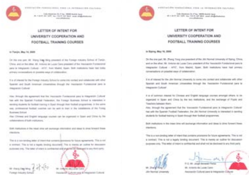
Cartas de Intención firmadas con ‘Jilin Normal University’ de Siping y con el ‘Foreign Industry School’ de Tianjin