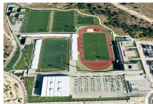
Arriba, vista aérea de la 'Ciudad del Fútbol' de la RFEF en Las Rozas, Madrid, donde se impartirán los cursos de AFIC y la RFEF.

AFIC tiene un acuerdo en con la 'CHINA EDUCATION EXPERT ASSOCIATION' y el 'CHINA YOUTH CONCERN COMMITTEE EDUCATION DEVELOPMENT CENTER' ambos organismos del gobierno Chino, para la realización en España de todo tipo de cursos de idiomas, culturales, educativos y deportivos con jóvenes Chinos.