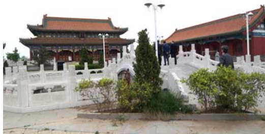
Arriba, vista del templo budista. Abajo, la delegación de AFIC junto con un Monje.