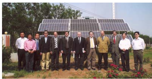
La delegación de AFIC durante la visita a una Fábricas de Paneles Solares en Dezhou con la que se firmó un acuerdo

Desde su apertura, China se esta desarrollando rápidamente lo que supone también una creciente demanda de energía y una creciente polución. Grandes ciudades como Shanghai tienen problemas de abastecimiento eléctrico en verano y en invierno. La búsqueda de energías alternativas es una necesidad.