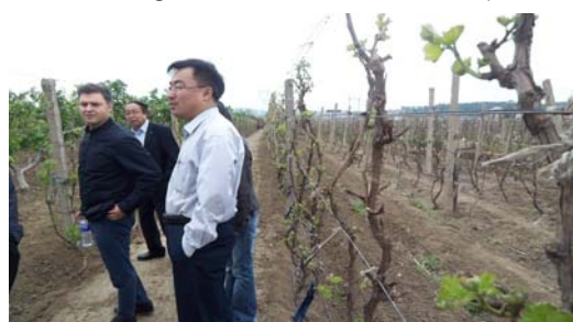
Representantes de la Bodega Inspeccionando Viñedos en China

finés, a falta de ensayos adicionales de los terrenos. La bodega sería productiva en cuatro años y contará con enólogos chinos instruidos en La Rioja.