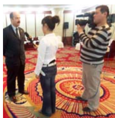
Entrevista de miembros de la delegación para la televisión